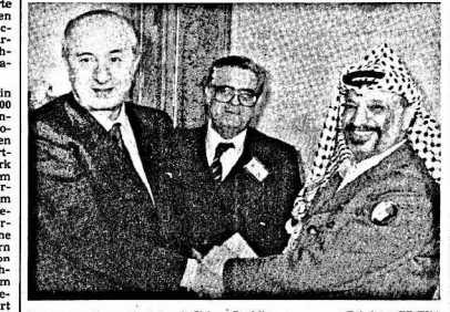
Begegnung Yasser Arafats mit Ciriaco De Mita

Rom (ADN). Der Vorsitzende des Exekutivkomitees der Palastinensischen Befreiungsorganisation (PLO), Yasser Arafat, traf am Freitag in Rom mit Ministerprasident Ciriaco De Mita, dem Beschliee des Palastinensischen Nationalrates von Algier bekraftigt.